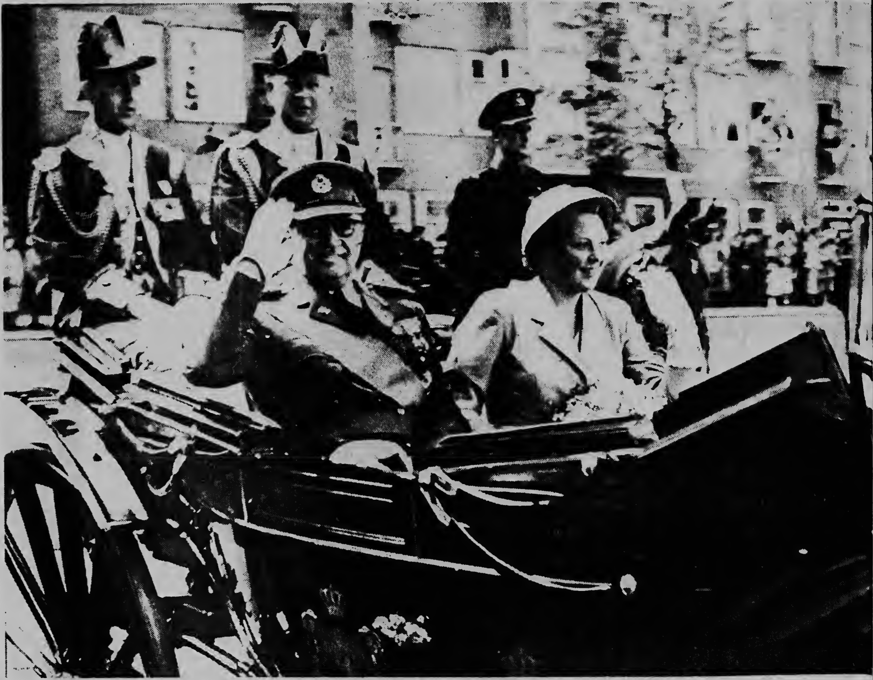
Na verano di anja pasa Grouthertogin di Luxemburg y su esposo Prins Felix a haci un bishita oficial na Amsterdam. E portret aki di nos Princesa Heredera hunto coe Prins Felix a ser saca durante un paseo de coche na Amsterdam.

Ta di comprende cu Legislador tin algun consecuencia relaciona na e semehante momento interesante den bida dje probable heredera di Trono. Na prome luga foi e dia ai legalmente e Princesa ta miembro di Raad van State. Den e colegio aqñ, certa un consejo central di hombernan capaz e ta hanja instruccion politica practica cu bista riba su porvenir.